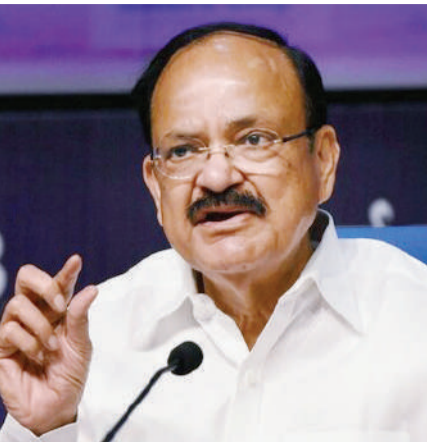
माजी उपराष्ट्रपती एम. व्यंकय्या नायडू यांच्या वयाच्या पंच्याहत्तरीनिमित्तय पंतप्रधान नरेंद्र मोदी यांनी लिहिलेला लेख....

भारताचे माजी उपराष्ट्रपती आणि आदरणीय राजकीय नेते एम. व्यंकय्या नायडू गारू आज ७५ वर्षांचे होत आहेत. मी त्यांना दीर्घ आणि निरोगी आयुष्यासाठी शुभेच्छा देतो आणि त्यांच्या सर्व हितचिंतकांना आणि समर्थकांना देखील शुभेच्छा देतो. ज्या नेत्याचा जीवन प्रवास संपर्ण, अनुकूलता आणि जनतेच्या जीवनात अविचल बांधिलकीचे दर्शन घडवतो, अशा नेत्याचा सन्मान करण्याचा हा एक प्रसंग आहे. राजकीय क्षेत्रातील त्यांच्या सुरुवातीच्या काळापासून ते उपराष्ट्रपती म्हणून त्यांच्या कार्यकाळापर्यंत, व्यंकय्या गारू यांची कारकीर्द भारतीय राजकारणातील गुंतागुंतींना सहजतेने आणि विनम्रतेने हाताळण्याच्या त्यांच्या असामान्य क्षमतेचा दाखला देते. त्यांचे वक्तृत्व, विद्वता आणि विकासाच्या मुद्द्यांवर सातत्याने असलेला भर यामुळे त्यांच्या सर्वच पक्षांकडून आदर प्राप्त झाला आहे.