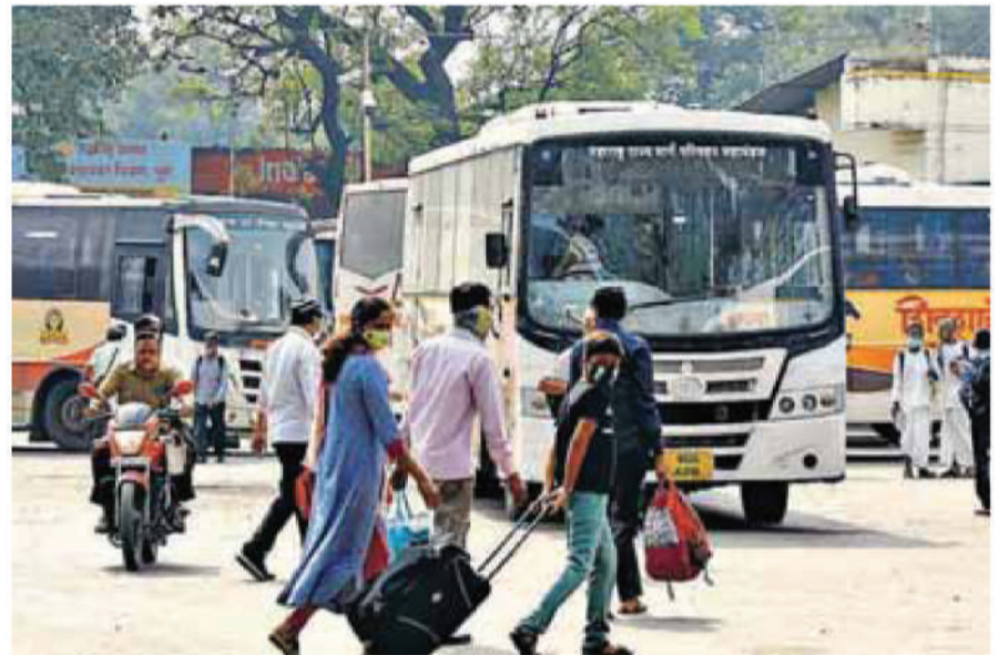
पुणे : एसटी महामंडळातर्फे सोमवारी १५ जुलैपासून प्रवासी आणि कामगारांच्या समस्या, तक्रारी, सूचना यांचे स्थानिक पातळीवर जलद गतीने निकालात काढण्यासाठी आगारनिहाय प्रवासी राजा दिन' तसेच, 'कामगार पालक दिन' आयोजित करण्यात येणार आहे. या उपक्रमांतर्गत संबंधित विभागाचे विभाग नियंत्रक हे वेळापत्रकानुसार एका आगारामध्ये जाऊन प्रवासी तसेच एसटी कामगारांच्या सामान्य जाणून घेणार आहेत.

अंतर्गत अरुणाचल प्रदेशात १२ जलविद्युत प्रकल्पांसाठी सुमारे १० अब्ज रुपये उचलव्य करून दिले जाणार आहेत. या निधीतून राज्य सरकारला स्थानिक लोकांचे पुनर्वसन करण्यास मदत मिळणार आहे. जलविद्युत प्रकल्पांची घोषणा २०२४-२५ च्या अर्थसंकल्पात केली जाण्याची अपेक्षा आहे. भारत सरकार २३ जुलै अर्थसंकल्प सादर करणार आहे. ऑगस्ट २०२३ मध्ये भारत सरकारने सीमाक्षेत्रात पायाभूत सुविधांच्या विकाससाठी एक व्यापक योजनेच्या हिस्स्याच्या स्वरूपात ११.५ गीगावॉट क्षमतेच्या प्रकल्प आहे.