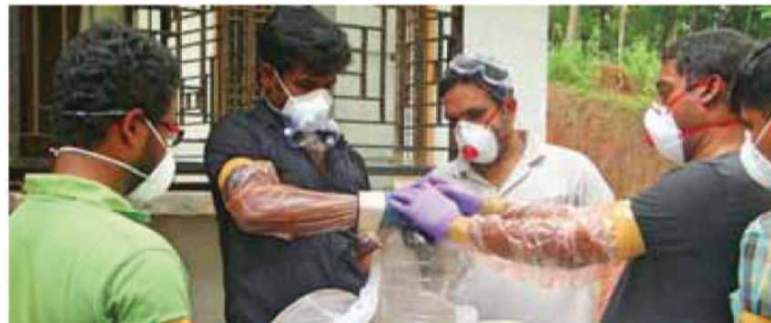
मलपुरम: चांदीपुरा व्हायरसनेतर देशात निपाह विषाणूने पुन्हा प्रवेश केला आहे. त्याची सुस्पष्ट केरळपासून झाली आहे. केरळमधील मलपुरम जिल्ह्यात एका १४ वर्षीय तरुणाला निपाह व्हायरसची लागण झाली आहे. केरळमधील निपाह व्हायरसची ही पाचवी घटना आहे. राज्यात या विषाणूबाबत अलर्ट जारी करण्यात आला आहे.

देशोन्नती वृत्तसंकलन धर्माच्या नावाखाली द्वेषाचे राजकारण केले जात असल्याने या आदेशाला न्यायालयात आव्हान दिले जाईल, असे जमियत उलेमा-ए-हिंदने म्हटले आहे. कावड यात्रेशी संबंधित हा आदेश भेदभावपूर्ण आणि जातीवादी असल्याचे सांगून सर्व कायदेशीर बाबींचा विचार करण्याचेही म्हटले आहे.