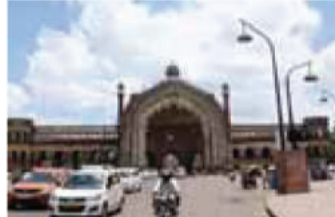
प्रभावी व्यवस्थापन सुनिश्चित करेल.

जिल्हांचा समावेश आहे. अधिसूचनेनुसार, एकूण २७८२६ चौरस किलोमीटर क्षेत्र त्यामध्ये समाविष्ट केले जाईल. त्यासाठी नेमण्यात आलेले प्राधिकरण विकास प्रकल्पांच्या अंमलबजावणीवर देखरेख करेल आणि नवीन परिभाषित क्षेत्रांमध्ये संसाधनांचे