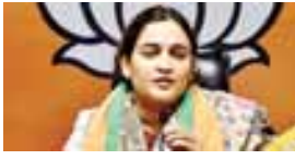
बोलले जात आहे.

लखनौ: भारतीय जनता पक्षाच्या नेत्या अपर्णा यादव या पक्षाला मोठा धक्का देण्याच्या तयारीत असल्याचे दिसत आहे, कारण अपर्णा यादव या पुन्हा एकदा समाजवादी पक्षात जाणार असल्याची शक्यता वर्तवण्यात येत आहे. २०२२ च्या विधानसभा निवडणुकीपूर्वी भाजपमध्ये प्रवेश केलेल्या अपर्णा यांची नुकतीच महिला आयोगाच्या उपाध्यक्षपदी नियुक्ती करण्यात आली आहे. तरीही त्यांनी हा निर्णय घेणे हे सर्वासाठी धक्का असल्याचे