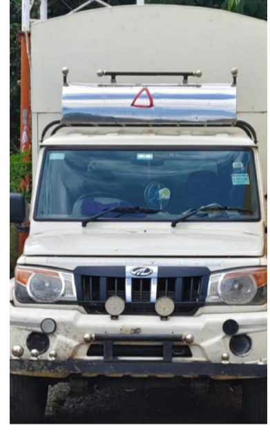
असताना (एमएच ०४/एलई/०४९७) असा

पोलीस सुत्रांकडून मिळालेली अधिक माहिती अशी की, शनिवार दि. १४ रोजी पहाटे अडीच वाजेच्या सुमारास आशी तालुक्यातील खडकत परिसरात पोलीस रात्रीच्या गस्तीवर