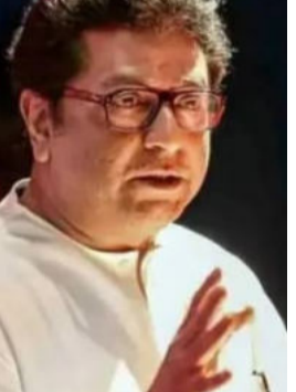
पण आमचे डॉक्टर या बीडीडी चाळीत राहायचे, अशी आठवण राज ठाकरेंनी आज सांगितली. ते पुढे म्हणाले, गेले अनेक

बीड/पुण्यभूमीप्रतिनिधी वरळी विधानसभा मतदारसंघात म्हणजे आदिपत्य ठाकरे यांच्या मतदारसंघातून महाराष्ट्र नवनिर्माण सेनेचे अध्यक्ष राज ठाकरे यांनी झंझावाती भाषण केलं. टाऊन प्लानिंगपासून पुतळ्याच्या राजकारणापर्यंत राज ठाकरेंनी सडेतोड भाषण केलं. तसंच, राजकारण्यांसह बिल्डरनांभीपासूनही सावध व्हा असं आवाहन राज ठाकरेंनी केलं. वरळीत आज मनसेकडून वरळी व्हिजन कार्यक्रमचं आयोजन करण्यात आलं होतं, तिथे ते बोलत होते. मला ही बीडीडी चाळ समोर दिसली की मला माझं बालपण आठवतं. वडिलांबरोबर मी येथे येत असे. कोणत्या इमारतीत राहायचे हे आठवत नाही,