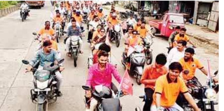
राष्ट्रीय कॉन्ट्रॅक्टर लेबर युनियनद्वारा विश्वकर्मा जयंतीनिमित्त बाईक रॅली काढण्यात आली.