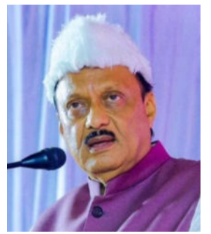
आघाडीने टीका केली आहे. तर ही योजना बंद पान २ वर...

बीड/पुण्यभूमी प्रतिनिधी महाराष्ट्र सरकारने मुख्यमंत्री माझी लाडकी बहीण योजना सुरू केली आहे. या योजनेअंतर्गत राज्यातील पात्र महिलांना दरमहा दीड हजार रुपये दिले जात आहेत. जुलै महिन्यापासून ही योजना सुरू केली असून आतापर्यंत दीड कोटीहून अधिक महिला पात्र ठरल्या आहेत. त्यापैकी कोट्यवधी महिलांच्या खात्यात दोन महिन्यांचा निधीही जमा झाला आहे. मात्र, आता योजनावर महाविकास