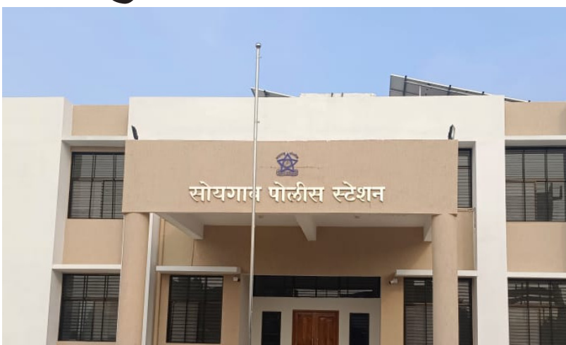
सोयगाव पोलीस ठाण्याची नवीन वास्तू धूळखात पडून

सोयगाव/पुण्यभूमी प्रतिनिधी गेल्या आठ महिन्यांपासून शहरात उभारण्यात आलेल्या सोयगाव पोलीस ठाण्याच्या इमारतीच्या लोकार्पण सोहळ्यासाठी लोकसभा निवडणुकीपाठोपाठ आता विधानसभा निवडणुकीच्या आचारसंहितेच्या बडव्यात या इमारतीच्या लोकार्पण सोहळा अडकला आहे त्यामुळे आता सोयगाव पोलीस ठाण्याच्या कारभार आता २०२५ या नवीन वर्षातच नवीन वास्तूमध्ये सुरु होण्याची शक्यता आहे सोयगाव शहरात शासनाने पाच कोटी नऊ लक्ष रु निधी खर्चून पोलीस ठाण्याची भव्य वास्तू उभारली फेब्रुवारी २०२४ मध्ये या इमारतीच्या काम पूर्ण झाले होते परंतु लोकसभा निवडणुकीची आचारसंहितेमुळे हे लोकार्पण स्थगित झाले मात्र लोकसभा निवडणुकीच्या निकाला नंतर राज्याचे गृहमंत्री देवेंद्र फडणवीस यांच्या हस्ते (ता .०२) व ता. १५ ऑगस्ट हे दोन मुहूर्त लोकार्पण सोहळ्यासाठी काढण्यात आले परंतु या दिवशीही लोकार्पण झाले नाही त्यामुळे सप्टेंबरमध्ये जिल्हा पोलीस