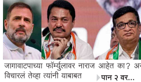
जागावाटपाच्या फॉर्म्युलावर नाराज आहेत का? असं विचारलं तेव्हा त्यांनी याबाबत पान २ वर...

दिल्ली/पुण्यभूमी प्रतिनिधी महाराष्ट्रात महाविकास आघाडीचा ८५-८५-८५ असा फॉर्म्युला ठरला आहे. मात्र या फॉर्म्युलावर राहुल गांधी नाराज असल्याची चर्चा रंगली होती. काँग्रेसची बैठक काही वेळापूर्वी दिल्लीत पार पडली. यानंतर महाराष्ट्र निवडणूक प्रभारी रमेश चेत्रिथला यांनी आमची दुसरी यादी लवकरच येईल असं सांगितलं. तर महाराष्ट्र काँग्रेसचे प्रदेश अध्यक्ष नाना पटोले यांना राहुल गांधी