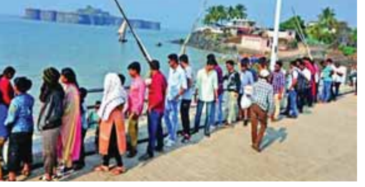
बोर्ली पंचतन : श्रीवर्धन तालुक्यातील विस्तीर्ण असे समुद्रकिनारे, नारळी पोफळीच्या बागा, मासे तसेच मंदिरे पर्यटकांसाठी नेहमीच आकर्षण ठरत असतात. शाळांना दिवाळीच्या सुट्ट्या असल्यामुळे श्रीवर्धन कडे पर्यटकांचा ढळ वाढू लागला आहे त्यामुळे दिवाळी सुट्ट्यांमध्ये श्रीवर्धन मधील दिवेआगर, श्रीवर्धन, हरिहरेश्वर येथील पर्यटन फुललेले दिसून येत आहे.

पाचशे ते सातशे हेक्टरपेक्षा अधिक क्षेत्रावरील भात पिकाची कापणी केली जात आहे. परतीचा पाऊस कधीही कोसळण्याची शक्यता असल्याने तसेच दिवाळी झाल्यानंतर येथील मजूर वीथ भट्टीच्या कामासाठी भिवंडी, कल्याण तालुक्यात जाण्याच्या तयारीत असल्याने येथील शेतकऱ्यांनी झोडणीचे कामही उरकून घेण्यास सुरुवात केली आहे.