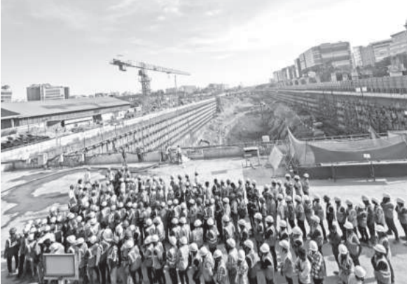
आहे. मुंबई-ठाणे-पालघर जिल्ह्यातून थेट गुजरात राज्याला जोडणाऱ्या बुलेट ट्रेन प्रकल्पाची उत्सुकता सर्वांना लागून आहे. त्यामुळे प्रकल्पात काम करणाऱ्या कामगारांना उत्साह वाढवा आणि सुरक्षित काम

परदेशात अथवा चित्रपटात धावणारी बुलेट ट्रेन सर्वांचीच पहिली असली तरी आता प्रत्यक्षत पुढच्या काही दिवसात धावताना दिसणार