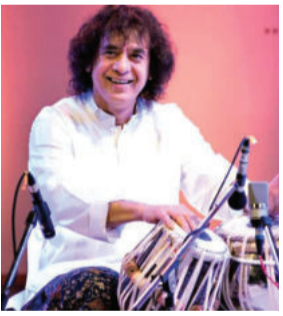
होतं. मात्र उपचारांदरम्यान झाकीर हुसैन यांची प्राणज्योत

'वाह उस्ताद वाह' म्हणत तबल्यावर लिलया पडणारी थाप शांत! मुंबई/पुण्यभूमी प्रतिनिधी सुप्रसिद्ध तबला वादक झाकीर हुसैन (नरझळी वीररूप) यांचं निधन झालं आहे. वयाच्या ७३ व्या वर्षी त्यांनी अखेरचा श्वास घेतला. त्यांच्या मागे त्यांची पत्नी आणि दोन मुली असं कुटुंब आहे. झाकीर हुसैन यांना सॅनफ्रॅन्सिस्को येथील रुग्णालयात दाखल करण्यात आलं होतं. त्यांच्यावर उपचार सुरु होते, तसंच त्यांची प्रकृती गंभीर आहे असंही कळत