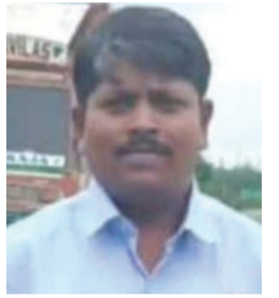
करत भिम सैनिकांना तडकाफडकी अटक केली आहे. यात वडार समाजाचे असणारे पान २ वर...